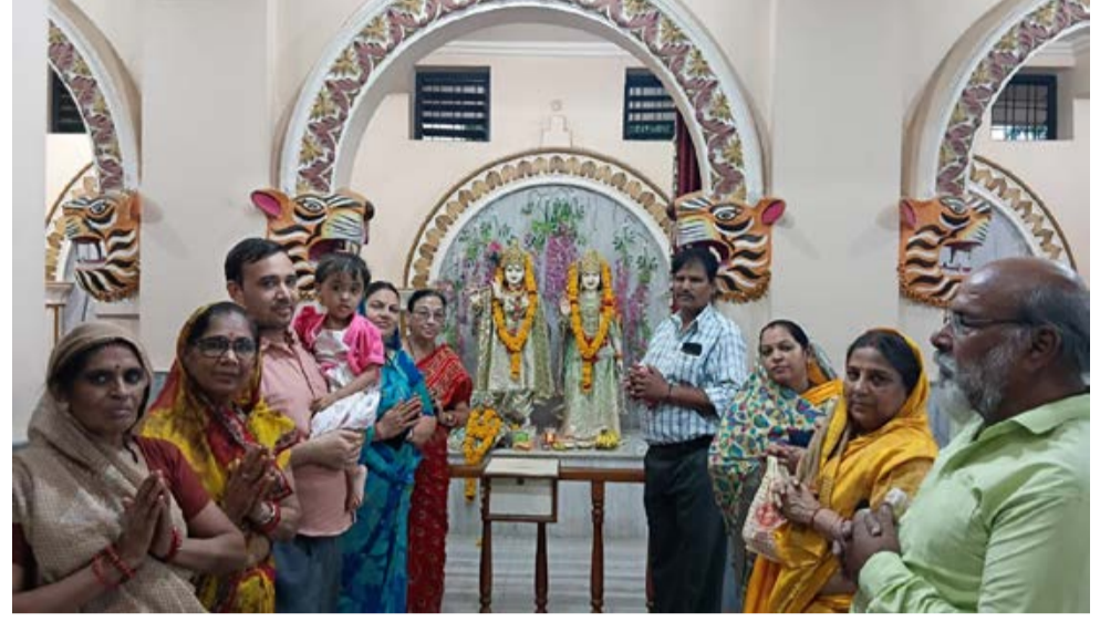
दैनिक कारखाने का सफर। भोपाल

जागत एवं दर्शनीय तीर्थस्थल दादाजी धाम मंदिर, रायसेन रोड, पटेल नगर, भोपाल में अधिकमास की पावन परमा (कमला) एकादशी के शुभ अवसर पर गुरुवार को भगवान लक्ष्मी-नारायण, राधा-कृष्ण एवं लड्डू गोपाल का विशेष एवं मनोहारी श्रृंगार किया गया। इस अवसर पर सायं 5:30 बजे से श्री सत्यनारायण कथा, पूजन, महाआरती एवं भजन-संध्या का आयोजन सम्पन्न हुआ। मंदिर में विराजित भगवान श्रीकृष्ण त्रिभंग मुद्रा में भक्तों को दिव्य दर्शन दे रहे थे। उनके हाथों में सुशोभित मुरली प्रेम, माधुर्य एवं भक्ति का संदेश प्रदान कर रही थी।