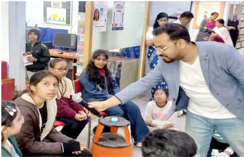
दैनिक कारखाने का सफर। भोपाल