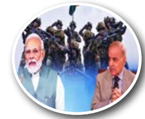
ऑपरेशन सिंदूर का सच आरा सामने... पेज 5