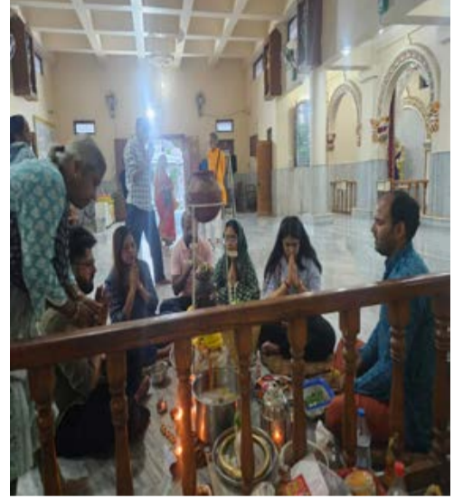
दैनिक कारखाने का सफर। भोपाल

जागृत एवं दर्शनीय तीर्थ स्थल दादाजी धाम मंदिर, रायसेन रोड, पटेल नगर, भोपाल में मंगलवार को संकष्टी गणेश चतुर्थी एवं ज्येष्ठ माह के प्रथम बड़ा मंगल का पावन एवं दुर्लभ संयोग श्रद्धा एवं भक्तिभाव के साथ मनाया गया। इस शुभ अवसर पर सामूहिक रूप से भगवान शिव का अभिषेक तथा हनुमान चालीसा का पाठ किया गया। इस दिन भगवान शिव के अभिषेक का विशेष महत्व बताया गया है। शास्त्रों के अनुसार संकष्टी चतुर्थी पर भगवान गणेश की आराधना के साथ भगवान शिव का अभिषेक करने से