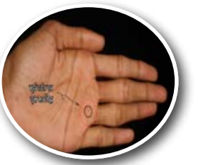
सूर्य पर्वत पर त्रिभुज, नक्षत्र समेत... पेज 7

मुकाबले के चक्कर में आदमी का जीवन एक कारखाने के समान हो गया है, आदमी का सबसे विश्वसनीय अवतार