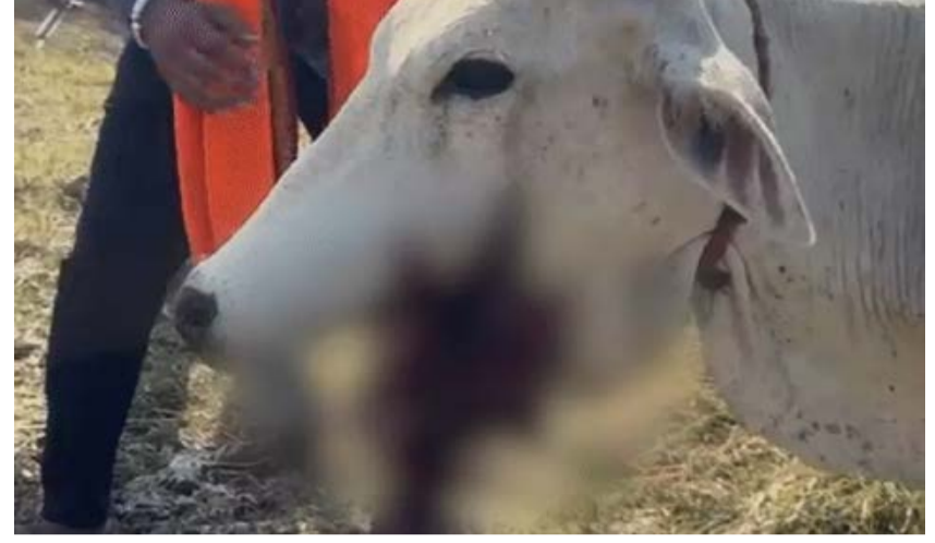
दैनिक कारखाने का सफर। बैतूल

मध्यप्रदेश के बैतूल जिले के शाहपुर में तालाब के पास गोवंश के मुंह धमाकों से फट गए। इससे 3 गावों की मौत हो गई। वहीं 11 गोवंश घायल हो गए। उनके मुंह और जबड़े बुरी तरह फट गए हैं। मामला शाहपुर के कोयलारी गांव (पंचायत कछार) में मंगलवार का