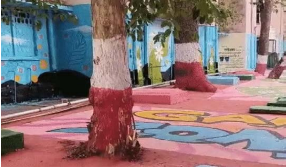
दैनिक कारखाने का सफर। भोपाल

स्वच्छ सर्वेक्षण 2025-26 के अंतर्गत संचालित देशव्यापी 'सिटीजन फीडबैक' (नागरिक प्रतिक्रिया) में मध्य प्रदेश पूरे देश में पहले स्थान पर रहा। प्रदेश के 35.69 लाख से अधिक लोगों ने ऑनलाइन माध्यम से अपनी सहभागिता दर्ज कराई। नगरीय विकास एवं आवास मंत्री कैलाश विजयवर्गीय ने कहा, नागरिकों की अटूट जागरूकता और विभागीय अमले की कर्तव्य निष्ठता के समन्वय से ही प्रदेश स्वच्छता के उच्च शिखर पर है। राज्य स्तर पर स्वच्छ भारत मिशन (शहरी) 2.0 की टीम ने इस वर्ष एक अनूठी '360 डिग्री रणनीति' का क्रियान्वयन किया। इस समेकित कार्ययोजना के अंतर्गत सभी नगरीय निकायों के सोशल मीडिया हैंडलस के माध्यम से 60 लाख से अधिक लोगों तक पहुंच स्थापित की गई। इसके अतिरिक्त पारंपरिक और आधुनिक संचार माध्यमों से ऑडियो-वीडियो संदेश और घर-घर जाकर चलाए गए सघन जन-जागरूकता अभियानों से समाज के हर वर्ग को इस पुनीत कार्य से जोड़ा गया। डिजिटल सहभागिता को सुगम और व्यापक बनाने के उद्देश्य से राज्य स्तर से एक करोड़ से अधिक एसएमएस (SMS) भेजे गए। वहीं, सोशल मीडिया इम्प्लूमेंटर्स की भी मदद ली गई। इसके चलते फीडबैक में प्रदेश देश में नंबर पर आ पाया है। भोपाल की बात करें तो पिछले साल 5.1 हजार फीडबैक दिए गए थे लेकिन इस बार इनकी संख्या 3.86 लाख से अधिक है।