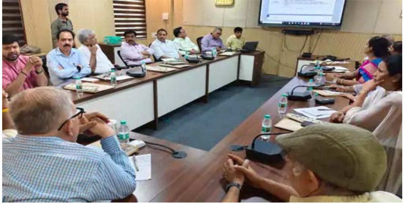
दैनिक कारखाने का सफर। भोपाल

राष्ट्रीय शिक्षा नीति 2020 के तहत भारतीय भाषाओं में उच्च शिक्षा की गुणवत्तापूर्ण पाठ्य सामग्री तैयार करने की दिशा में बड़ा कदम उठाया गया है। मध्यप्रदेश भोज मुक्त विश्वविद्यालय में भारतीय भाषा पुस्तक योजना को लेकर राज्य स्तरीय प्रारंभिक बैठक आयोजित की गई। यह बैठक भारतीय भाषा समिति, शिक्षा मंत्रालय भारत सरकार और मध्यप्रदेश भोज (मुक्त) विश्वविद्यालय के संयुक्त तत्वावधान में हुई।