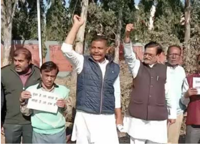
दैनिक कारखाने का सफर। भोपाल