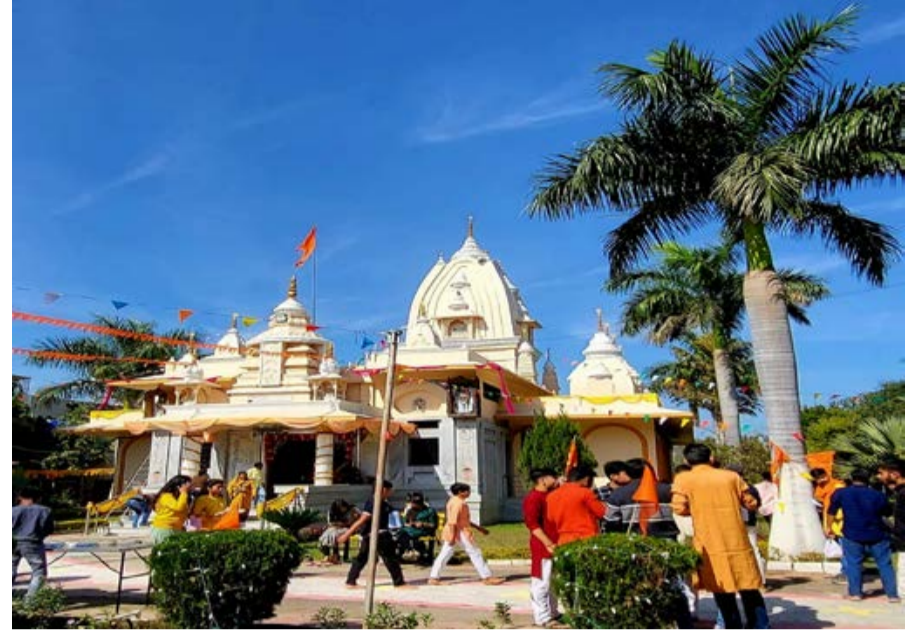
दैनिक कारखाने का सफर। भोपाल