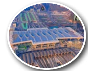
चीन की 'रोबोट सेना' ने बनाया... पेज 5