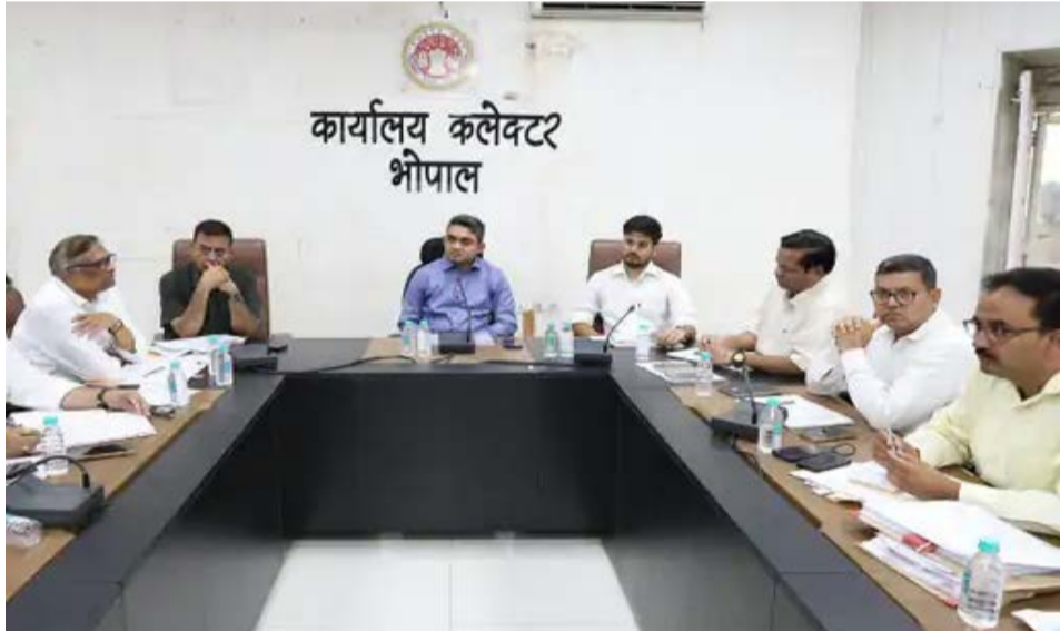
दैनिक कारखाने का सफर। भोपाल