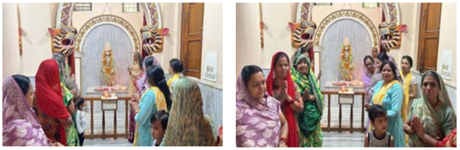
दैनिक कारखाने का सफर। भोपाल

जागत एवं दर्शनीय तीर्थ स्थल दादाजी धाम मंदिर, रायसेन रोड, पटेल नगर, भोपाल में ज्येष्ठ मास के तीसरे बड़ा मंगल एवं पुरुषोत्तम मास के पावन अवसर पर सायंकाल विशेष धार्मिक आयोजन श्रद्धा एवं भक्तिभाव के साथ सम्पन्न हुआ। इस अवसर पर भगवान श्री हनुमान जी की विशेष पूजन-अर्चना, सामूहिक हनुमान चालीसा पाठ एवं महाआरती आयोजित की गई। भक्तों ने भजन-कीर्तन,