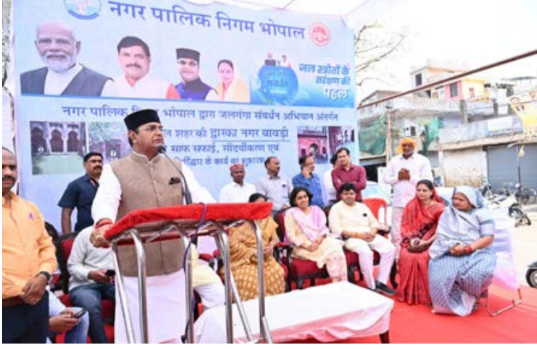
दैनिक कारखाने का सफर। भोपाल

सहकारिता, खेल और युवा कल्याण मंत्री श्री विश्वास कैलाश सारंग ने गुरुवार को जल गंगा संवर्धन अभियान के तहत नरेला विधानसभा के द्वारका नगर स्थित प्राचीन बावड़ी की सफाई हेतु श्रमदान किया एवं स्वच्छता मित्रों को किट वितरित कर उनका सम्मान एवं उत्साहवर्धन भी किया। उन्होंने कहा कि जल ही जीवन का आधार है और जल स्रोतों का संरक्षण वर्तमान समय की सबसे बड़ी आवश्यकता बन चुका है। मुख्यमंत्री डॉ. मोहन यादव के नेतृत्व में जल गंगा संवर्धन अभियान अंतर्गत प्रदेशभर में जल स्रोतों के संरक्षण, संवर्धन एवं पुनर्जीवन हेतु व्यापक स्तर पर कार्य किया जा रहा है। आगे उन्होंने कहा कि परंपरागत जल स्रोतों जैसे बावड़ी, कुएँ, तालाब एवं सरोवर हमारी सांस्कृतिक धरोहर हैं जिन्हें संरक्षित करना प्रत्येक नागरिक की जिम्मेदारी है। मंत्री श्री सारंग ने नागरिकों से आह्वान किया कि वे जल संरक्षण को जनआंदोलन बनाते हुए वर्षा जल संचयन, जल स्रोतों की स्वच्छता एवं पर्यावरण संरक्षण के कार्यों में सक्रिय सहभागिता निभाएँ। विद्युत संबंधी सेवाओं के शिविर का शुभारंभ मंत्री श्री विश्वास सारंग ने नरेला विधानसभा के चौदबड़ में संपर्क अभियान के तहत विद्युत संबंधी सेवा शिविर का शुभारंभ किया। इस शिविर में कनेक्शन संबंधी, बिल संबंधी, तकनीकी सेवाएँ सहित मीटर व केवल सर्विस संबंधी समस्याओं का समाधान किया जाएगा। मंत्री श्री सारंग ने अपने संबोधन में कहा कि भाजपा की सरकार में जनता को सरकार के द्वार नहीं आना