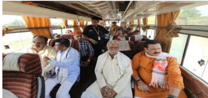
घटना से प्रभावित परिवारों से भेंट कर