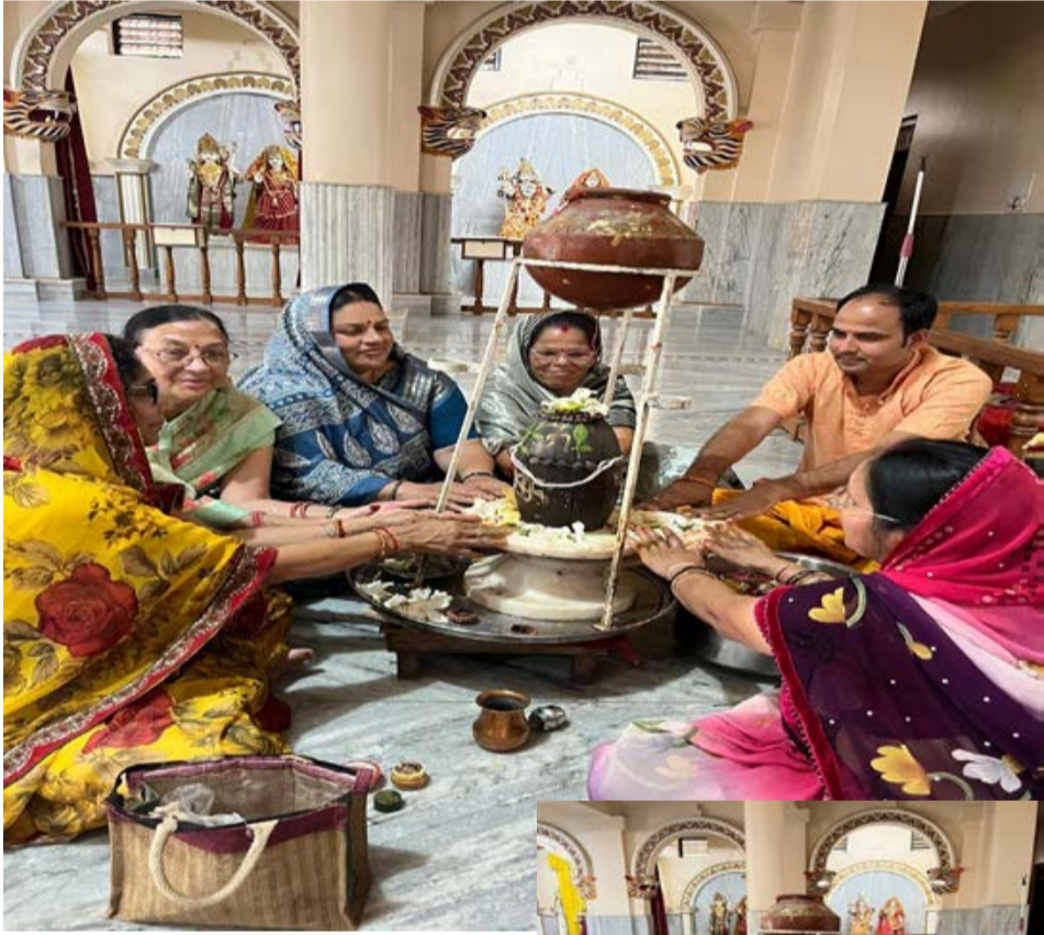
दैनिक कारखाने का सफर। भोपाल

ज्येष्ठ माह में इस वर्ष विशेष संयोग बन रहा है, जिसके चलते कुल 4 प्रदोष व्रत पड़ रहे हैं। प्रथम प्रदोष व्रत 14 मई, गुरुवार को जागृत एवं दर्शनीय तीर्थ स्थल दादाजी धाम मंदिर में श्रद्धा एवं भक्तिभाव के साथ मनाया गया। इस अवसर पर भगवान शिव का विधि-विधान से रुद्राभिषेक किया गया तथा उपस्थित श्रद्धालुओं एवं भक्तों द्वारा "ॐ नमः शिवाय" मंत्र का सामूहिक जाप कर वातावरण को भक्तिमय बनाया गया। मंदिर में उपस्थित सभी भक्तों द्वारा भगवान शिव का जल, दुग्ध, बेलपत्र एवं पुष्प अर्पित कर श्रद्धापूर्वक अभिषेक एवं रुद्राभिषेक किया गया तथा सुख-समृद्धि एवं लोककल्याण की कामना की गई। प्रदोष व्रत का हिंदू धर्म में विशेष महत्व माना गया है। धार्मिक मान्यता के अनुसार प्रदोष काल में भगवान शिव की पूजा एवं रुद्राभिषेक करने से समस्त कष्टों का निवारण होता है तथा भक्तों को सुख, शांति, आरोग्य एवं