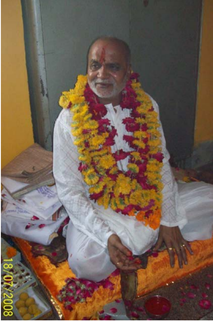
दैनिक कारखाने का सफर। भोपाल