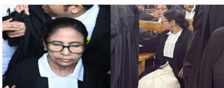
दैनिक कारखाने का सफर। कोलकाता