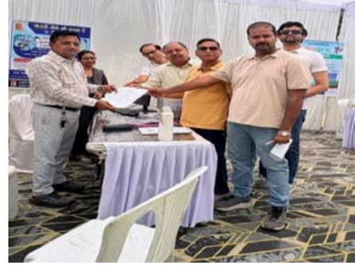
दैनिक कारखाने का सफर। भोपाल

मध्य क्षेत्र विद्युत वितरण कंपनी ने आज चूना भट्टी में संपर्क अभियान के तहत शिविर लगाकर उपभोक्ताओं की शिकायतों को सुना और उनका निराकरण किया। कंपनी के शाहपुरा जोन द्वारा ये शिविर अमलतास फेज तीन के गार्डन में आयोजित किया गया। शाहपुरा जोन