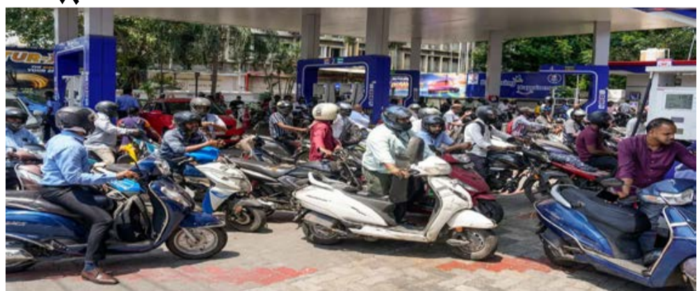
दैनिक कारखाने का सफर। एजेंसी नई दिल्ली

पेट्रोल-डीजल के दाम में आज बढ़ोतरी हो गई है। दिल्ली में पेट्रोल 3 रुपये और डीजल भी तीन रुपये महंगा हो गया है। इंडियन ऑयल द्वारा जारी नए रेट के मुताबिक दिल्ली में पेट्रोल आज से 97.77 रुपये लीटर हो गया है। जबकि डीजल 90.67 रुपये लीटर हो गया है। इससे पहले यहां डीजल 87.67 रुपये और पेट्रोल 94.77 रुपये लीटर बिक रहा था। कोलकाता में आज से पेट्रोल 108.74 रुपये लीटर हो गया है। जबकि डीजल 95.13 रुपये लीटर हो गया है। इंडियन ऑयल द्वारा जारी नए रेट के मुताबिक चेन्नई में आज शुक्रवार 15 मई से पेट्रोल 103.67 रुपये लीटर हो गया है। जबकि डीजल 95.25 रुपये लीटर हो गया है। आखिर वही हुआ, जिसका डर था। पेट्रोल-डीजल के दाम बढ़ गए। वैसे तो दाम बढ़ने के कयास चुनाव से पहले ही लगाए जा रहे थे कि चुनाव बाद पेट्रोल-डीजल के दाम बढ़ेंगे, क्योंकि दुनिया के