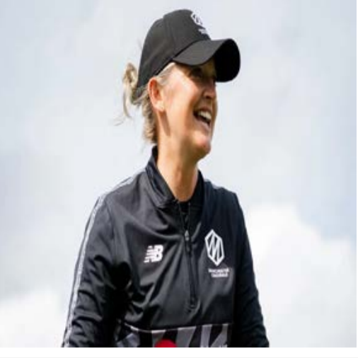
नई दिल्ली

इंग्लैंड की पूर्व विकेटकीपर सारा टेलर को न्यूजीलैंड के खिलाफ आगामी श्रृंखला के लिए सीनियर पुरुषों की टेस्ट टीम का क्षेत्ररक्षण कोच नियुक्त किया गया है। इंग्लैंड एवं वेल्स क्रिकेट बोर्ड (ईसीबी) के क्रिकेट निदेशक रॉब की ने बुधवार को यह घोषणा की। महिला क्रिकेट के इतिहास की महानतम खिलाड़ियों में से एक मानी जाने वाली 37 वर्षीय टेलर ने एंड्रयू फिल्टॉफ के नेतृत्व में इंग्लैंड लायंस (इंग्लैंड ए) टीम के साथ भी काम किया है। वहां उनके शानदार प्रदर्शन के चलते उन्हें सीनियर टीम के सहयोगी स्टाफ में जगह मिली है। सभी प्रारूप में कुल 226 मैच खेलने वाली टेलर ने ससेक्स की पुरुषों की टीम के साथ-साथ मैनचेस्टर ओरिजिनल्स के साथ भी काम किया है। उन्हें क्षेत्ररक्षण कोच के तौर पर एक संक्षिप्त कार्यकाल के अनुबंध की पेशकश की गई है। इस पद पर वह कार्ल हॉपकिंसन की जगह लेंगी जो