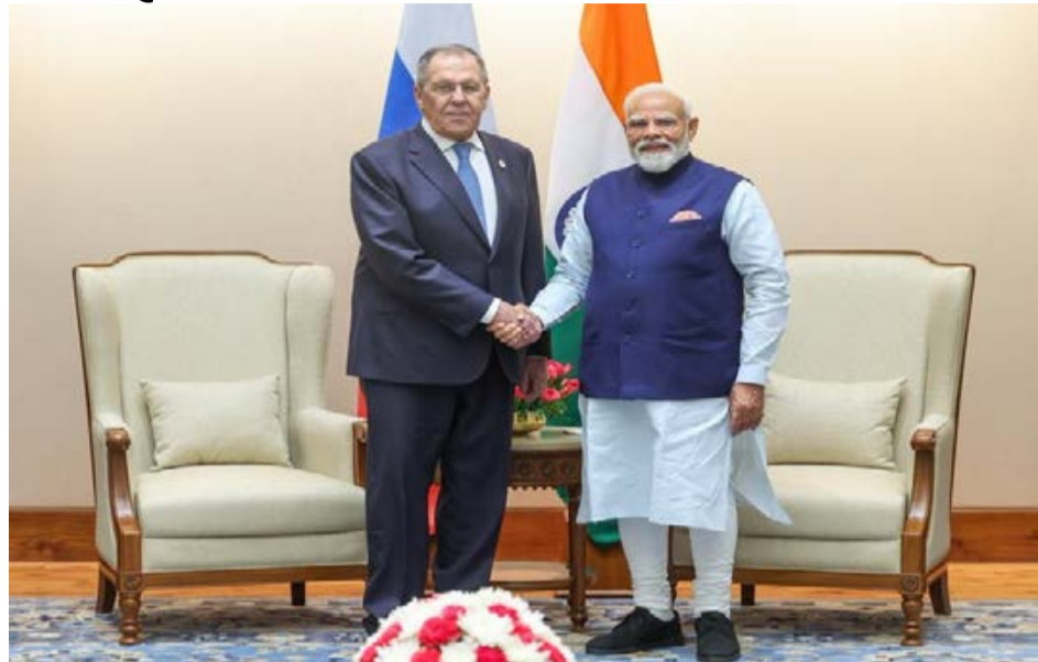
दैनिक कारखाने का सफर। नई दिल्ली

प्रधानमंत्री नरेंद्र मोदी ने गुरुवार को नई दिल्ली में ब्रिक्स विदेश मंत्रियों के शिखर सम्मेलन के दौरान इरानी विदेश मंत्री अब्बास अराघची और रूसी विदेश मंत्री सर्गेई लाँवरो से मुलाकात की। यह मुलाकात 14 से 15 मई तक राजधानी में आयोजित ब्रिक्स विदेश मंत्रियों और वरिष्ठ प्रतिनिधियों की दो दिवसीय बैठक के दौरान हुई। प्रधानमंत्री ने सदस्य और सहयोगी देशों के मंत्रियों और प्रतिनिधियों के साथ आधिकारिक ब्रिक्स परिवारिक तस्वीर में भी भाग लिया। इससे पहले दिन में, विदेश मंत्री एस जयशंकर ने शिखर सम्मेलन स्थल भारत मंडपम में कई विदेश मंत्रियों और वरिष्ठ राजनयिकों का स्वागत किया। औपचारिक चर्चा से पहले जयशंकर द्वारा स्वागत किए गए पहले नेताओं में रूसी विदेश मंत्री सर्गेई लाँवरो भी शामिल थे। इरानी विदेश मंत्री अब्बास अराघची भी उच्च स्तरीय बैठक के लिए स्थल पर पहुंचे। अमेरिकी राष्ट्रपति डोनाल्ड ट्रंप की चीन यात्रा के दौरान बीजिंग में ही रहे चीनी विदेश मंत्री