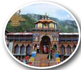
देवी पार्वती की ममता ने दिलाया... पेज 7

मुकाबले के चक्कर में आदमी का जीवन एक कारखाने के समान हो गया है, आदमी का सबसे विश्वसनीय अवतार