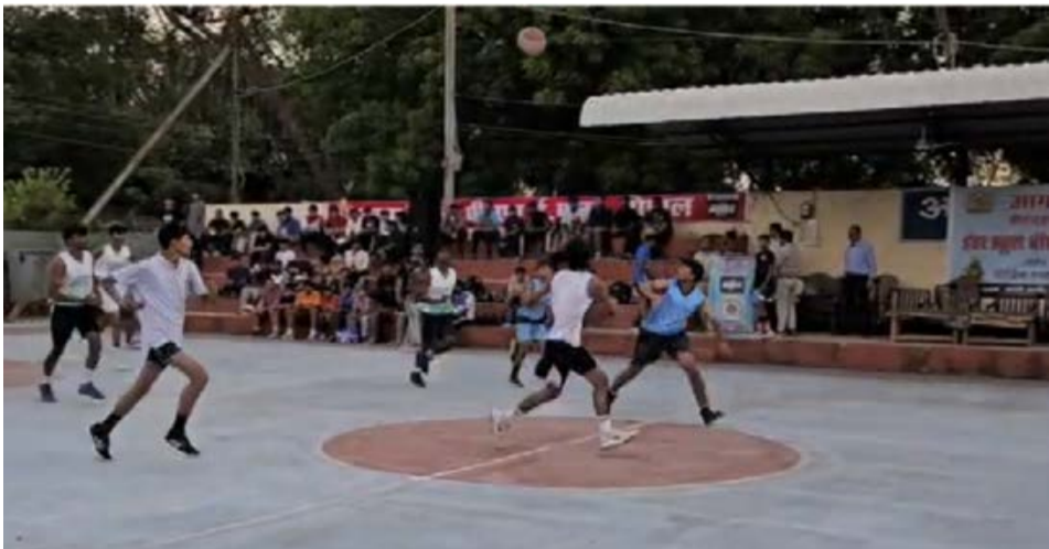
दैनिक कारखाने का सफर। भोपाल