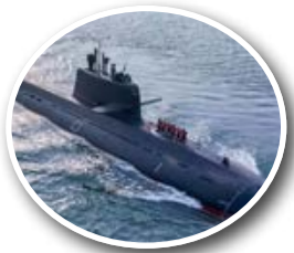
पाकिस्तान को हंगोर क्लास किलर... पेज 5