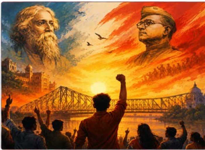
कॉलेज की घटना ने बंगाल की आत्मा को जो घाव दिए थे, उसका इलाज केवल संवेदनाओं

“जब पुलिस और प्रशासन पार्टी के डेरों के बजाय संविधान के प्रति जवाबदेह होंगे, तभी बंगाल का असली पुनर्जागरण होगा।” डर से मुक्ति: 'मौन' का टूटना- पांडकास्ट और जमीनी रिपोर्ट्स बताती हैं कि बंगाल में 'साइलेंट वॉरिंग' का एक बड़ा कारण हिंसा का डर रहा है। भाजपा की सरकार बनने के साथ ही उम्मीद जगी है कि अब मतदान के बाद किसी का घर जलाया नहीं जाएगा या किसी पति को उसकी पत्नी के सामने बाहर खींचकर मारा नहीं जाएगा। लोकतंत्र में जब 'डर' का अंत होता है, तभी विकास का मार्ग प्रशस्त होता है। महिला सुरक्षा: अब केवल 'दौदी' नहीं, 'न्याय' को बारी- आर.जी. कर मेडिकल