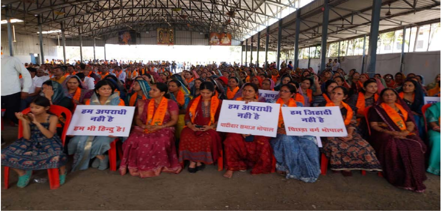
दैनिक कारखाने का सफर। भोपाल