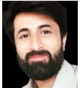
विशाल वाणी कोषाध्यक्ष एबू संबद्ध निफ्ट राष्ट्रीय सचिव निफ्ट