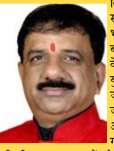
आज पेश हुए बजट में इनकम टैक्स में छूट की सीमा नहीं बढ़ाई गई जिससे देश के करोड़ों नौकरीपेशा लोगों को नुकसान हुआ देश के कारखानों में कार्य करने वाले करोड़ों श्रमिकों, मजदूरों एवं आउटसोर्स कर्मचारियों को ठेका प्रथा समाप्त कर उनका वेतन भी 30,000 रुपये प्रतिमाह किया जाना चाहिए था। जो की नहीं किया गया। यह बजट श्रमिक, मजदूर एवं कर्मचारी विरोधी बजट

की जीवन रक्षक दवाओं को शुल्क में छूट दी गई है। बायो फार्मा सेक्टर के लिए 10 हजार करोड़ का प्रावधान, 7 हाई स्पीड रेल कॉरिडोर, कई क्षेत्रों में बड़े टेक्सटाइल पार्क, शहरी आर्थिक क्षेत्र पर प्रतिवर्ष 5 हजार करोड़ खर्च का प्रावधान, 20 नए जलमार्गों का विकास, चार राज्यों में खनिज कॉरिडोर, तीन केमिकल पार्क, तीन नए आयुर्वेदिक एम्स बनाए जाने का प्रावधान इस बजट में किया गया है। आर्थिक विकास के ग्रोथ इंजिन में टेक्नोलॉजी का विस्तार कर हर वर्ग को विकास में भागीदार बनाने का इस बजट में प्रावधान किया गया है। ये बजट विकसित भारत 2047 के अटल संकल्प को पूरा करने की दिशा में महत्वपूर्ण भूमिका निभाएगा।