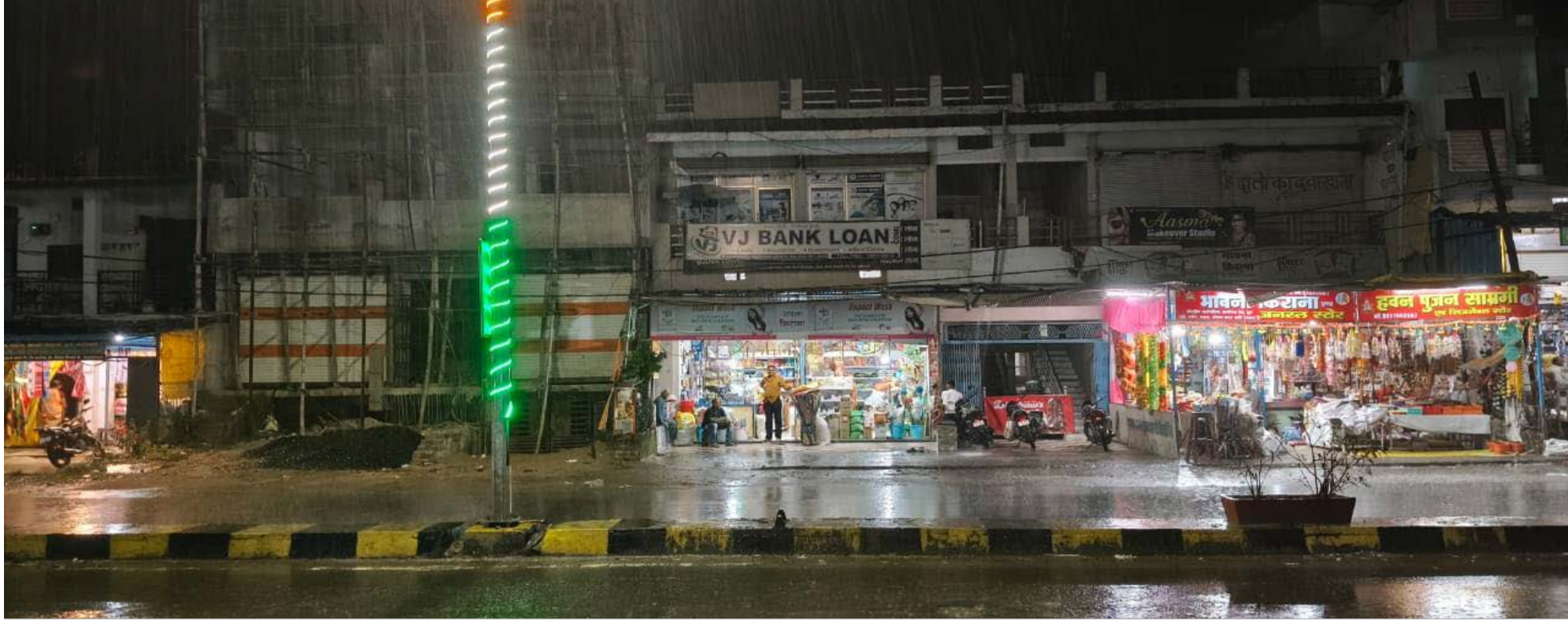
दैनिक कारखाने का सफर। सारनी

मौसम में परिवर्तन होने के कारण शहरी और ग्रामीण क्षेत्र के लोगों को बे-मौसम बारिश की वजह से काफी परेशानी का सामना करना पड़ रहा है। ग्रामीण क्षेत्र के किसानों को तो दोहरी मर का सामना करना पड़ रहा है किसानों के माध्यम से धन और मक्का की जो फसल खेत में काटकर छोड़ी गई है उसके बलिया झरने लग गई है और मक्का में फिर से दाने अंकुरित होने लगे हैं ऐसी स्थिति में बे-मौसम बारिश किसानों के लिए तबाही का आलम बनता दिखाई दे रहा है। रविवार को शाम 6 बजे के बाद आसमान में काले बादल छाने के साथ लगातार तेज बारिश लगभग एक घंटे तक हुई इस बारिश की वजह से माहौल एक बार फिर तीतर भीतर हो गया। आसमान में बादली छाप और बारिश होने के बाद भी ठंड ने अभी अंगड़ाई नहीं ली है। स्थिति अभी भी पंखा चालू करके लोगों को सोना पड़ रहा है। मौसम में परिवर्तन का खामियाजा किसानों को कब तक झेलना पड़ेगा यह अभी तक स्पष्ट होने की स्थिति में दिखाई नहीं दे रहा है।