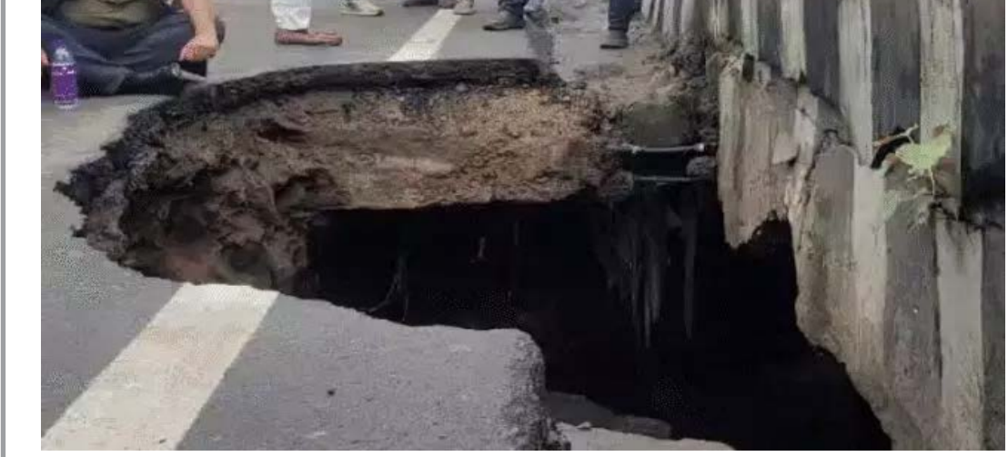
दैनिक कारखाने का सफर। भोपाल

भोपाल के एमपी नगर में 50 साल पुराने नाले पर प्री-कास्ट तकनीक से रेलवे के अंडरपास जैसा स्ट्रक्चर बनना है। इसके लिए पीडब्ल्यूडी ने 2 बार टेंडर निकाले, लेकिन ऐसा स्ट्रक्चर बनाने के लिए कोई नहीं आया और टेंडर कैंसिल हो गए। अब तीसरी बार टेंडर की प्रक्रिया शुरू की गई है। स्ट्रक्चर नहीं बनने से हर रोज 5 लाख से ज्यादा लोग परेशान हो रहे हैं। बता दें कि बोर्ड ऑफिस चौराहे से एमपी नगर चौराहे के बीच की सड़क 17 जुलाई को नाले के ऊपर बनी सड़क धंस गई थी। इसे अगले दो से तीन दिन में ठीक किया गया तो अगले हिस्से की सड़क धंसने लगी। तभी से आधी सड़क पर बेरिकेडिंग की गई है। इस वजह से कई बार जाम की स्थिति भी बनती है। इसे लेकर पीडब्ल्यूडी ने प्लान तैयार किया और टेंडर की प्रक्रिया शुरू की। प्लान बनाया कि इस पर रेलवे के अंडरपास जैसा ही स्ट्रक्चर बनाया जाए। पीडब्ल्यूडी के चीफ इंजीनियर संजय मस्के ने बताया, इस तकनीक के जरिए काम होने से 3 से 4 दिन ही लगेंगे। इससे सड़क ज्यादा दिन के लिए बंद नहीं करना पड़ेगी, लेकिन यदि मौके पर ही सीमेंट जंक्रिट