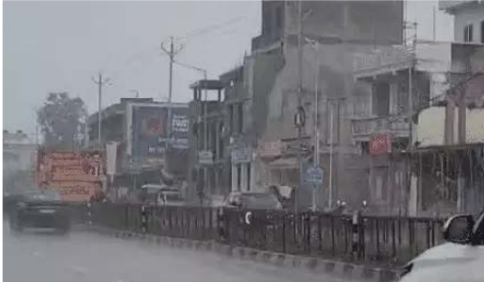
दैनिक कारखाने का सफर। भोपाल