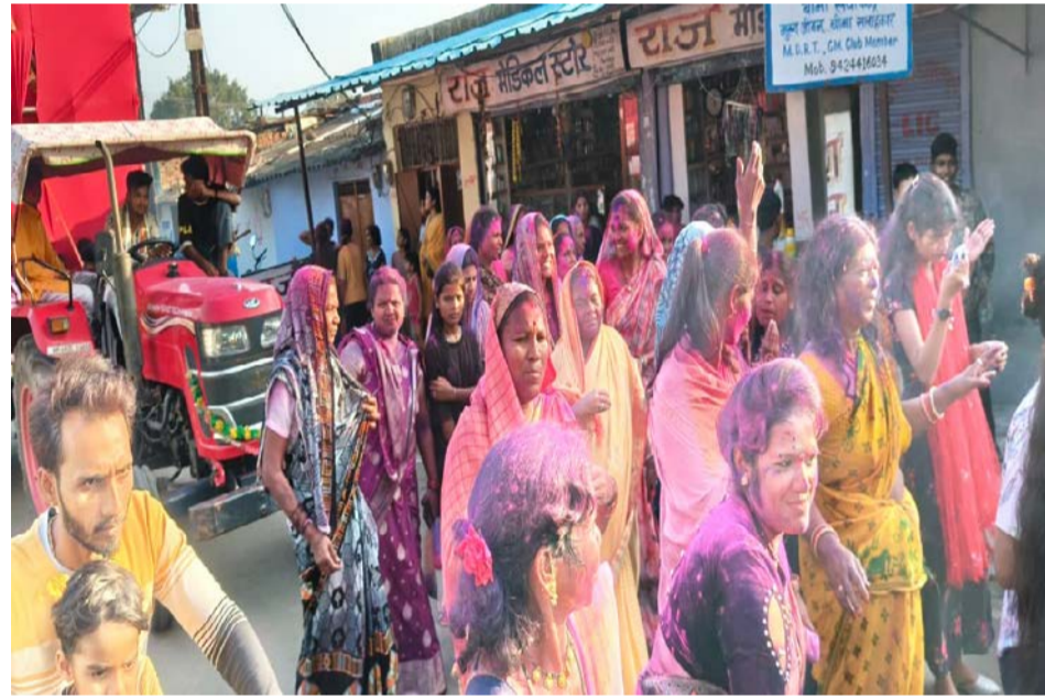
दैनिक कारखाने का सफर। सारनी

कोयलांचल क्षेत्र पाथाखेड़ा के बजरंग कॉलोनी में 15 वर्षों से बैठ रही मां काली की प्रतिमा का ग्यारस के दूसरे दिन युवाओं के माध्यम से विसर्जन करने का कार्य किया गया। डीजे की धुन और बैड बजे की बीच में युवा महिलाओं के माध्यम से खुशी का इजहार करते हुए नाचते गाते माता रानी की प्रतिमा को विदाई देने का काम किया गया इस बीच में आकर्षण का केंद्र यह रहा की मां काली की प्रतिमा के समीप खपर में गुगल सहित कई औषधीय लगातार जल रही थी जिसकी खुशबू इतनी प्यारी थी की राह चलने वाले हर किसी को अपनी तरफ या झांकी आकर्षित कर रही थी। नगरवासियों ने बताया कि दीपावली के दिन मां काली की प्रतिमा की स्थापना की जाती है और 11 दिनों तक पूजा आराधना करने के बाद ग्यारस के दूसरे दिन इस प्रतिमा की विदाई करने का कार्य किया जाता है। नगरवासीओं ने बताया कि पिछले 35 वर्षों से इसी पंडाल में मां दुर्गा की प्रतिमा की स्थापना भी निमित्त रूप से होते चली आ रही है जिसकी वजह से संपूर्ण कॉलोनी में धर्म मय माहौल बना रहता है। इसके अलावा संत रविदास वार्ड क्रमांक 23 में मां काली की प्रतिमा का की स्थापना की गई थी जिसका विसर्जन भी रविवार को ही किया गया इस अवसर पर बड़ी संख्या में महिला पुरुष उपस्थित रहे।