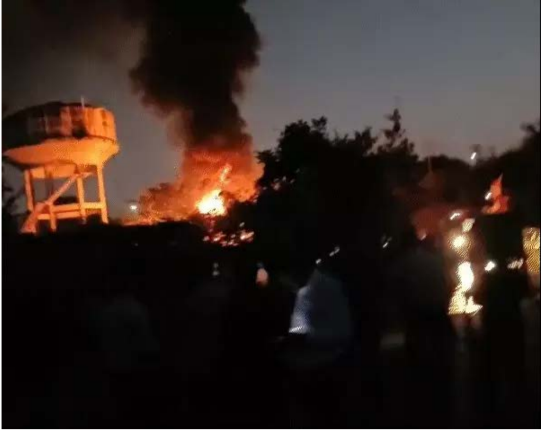
दैनिक कारखाने का सफर। भोपाल