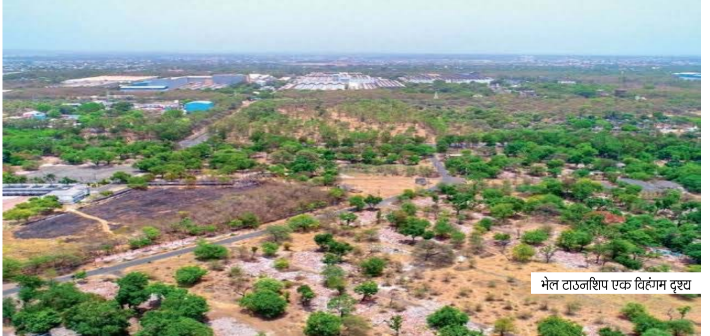
भेल टाउनशिप एक विहंगम दृश्य

भोपाल के लिए बड़े ही शर्म की बात है कि भेल कर्मचारियों की भेल टाउनशिप अब ठेकेदारों के पास चली गई है। किसी समय सपनों की नगरी के नाम से भेल टाउनशिप को जाना जाता था और इसको साफ सुधरा और सुंदर बनाए रखने के लिए कर्मचारी संगठन निगाह रखते थे। भेल कर्मचारियों ने आवासों को मालिका हक देने के लिए भी लंबी लड़ाई लड़ी और मकानों की दुर्दशा को देखते हुए रिनोवेशन का भी काम करने की मांग की गई, लेकिन कर्मचारियों की बात सुनने के बजाए प्रबंधन ने टाउनशिप ही खत्म कर दी यानि न रहेगा बांस और न बजेगी बांसुरी। वहीं एक लंबे समय से मालिका हक मांग रहे बाजारों के दुकानदार भी ठगे गए। भेल के पूर्व प्रबंधन ने अपनी एक-एक भूमि बचाने के लिए कब्जेधारियों, नेताओं और यहां तक प्रदेश सरकार से संघर्ष किया। वहीं वर्तमान प्रबंधन ने तुगलकी तरीका ढूंढा कि भूमि और मकान ठेके पर ही दे दिया। प्रबंधन ने जो भी शर्त रखी हो, लेकिन भेल कर्मचारियों को भी मांगलिक उद्यान श मांगलिक भवन आवंटन कराना होगा तो ठेकेदार के पास ही जाना पड़ेगा। जबकि कर्मचारी संगठन, भेल लोडीज क्लब या भेल की अपनी सांस्कृतिक संस्था भेकनिस को कम से कम मैदान आवंटन और मांगलिक उद्यान व भवन को सौंपा जा सकता था। अफसोस की बात यह है कि भेल प्रबंधन ने अपने ही कर्मचारियों पर भरोसा नहीं किया। अब आगे देखते हैं भेल स्पोर्ट्स काम्प्लेक्स कब ठेकेदार के हाथों सौंपा जा सकता है। अगर यही हाल रहा तो अगला टेंडर सीनियर क्लब और