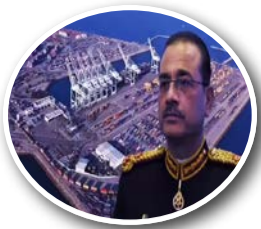
ईरान के लिए हम खुश लेकिन... पेज 5