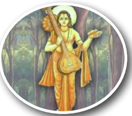
कामदेव ने साधा नारद की ... पेज 7