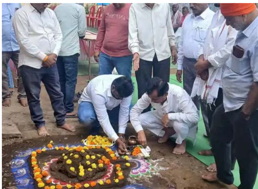
दैनिक कारखाने का सफर। बैतूल