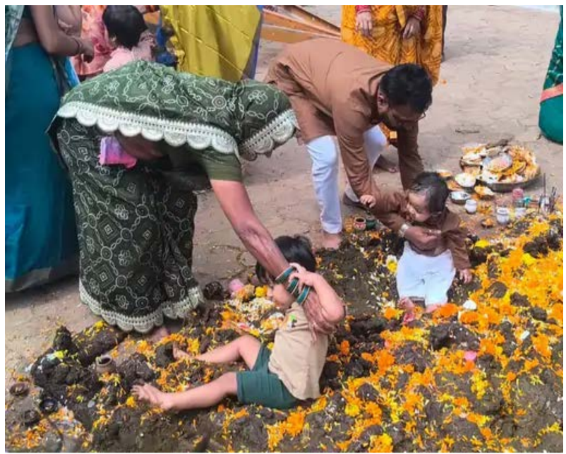
दैनिक कारखाने का सफर। बैतूल

बैतूल में दीपावली के अगले दिन गोवर्धन पूजा पर एक अनोखी परंपरा निभाई जाती है। यहां श्रद्धालु अपने छोटे बच्चों को गोबर से बने गोवर्धन पर्वत में डालते हैं। यह मान्यता है कि ऐसा करने से बच्चे सालभर निरोगी रहते हैं। यह प्रथा कृष्णपुरा वार्ड सहित कई क्षेत्रों में वर्षों से जारी है। इस परंपरा के