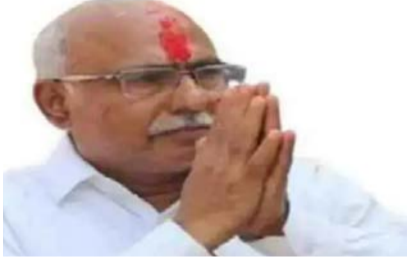
दैनिक कारखाने का सफर। भोपाल