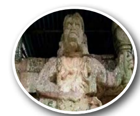
दो ईसाई देशों के जंगलों में हनुमान जी, ... पेज 5