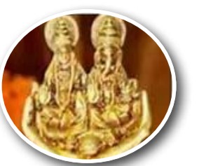
धनतेरस पर मां लक्ष्मी का पूजन.. पेज 7

आजकल आदमी की दिनचर्या कारखाने की तरह दिन-रात चल रही है, इस दिनचर्या पर ही इस अवधारणा का नाम रखा गया है