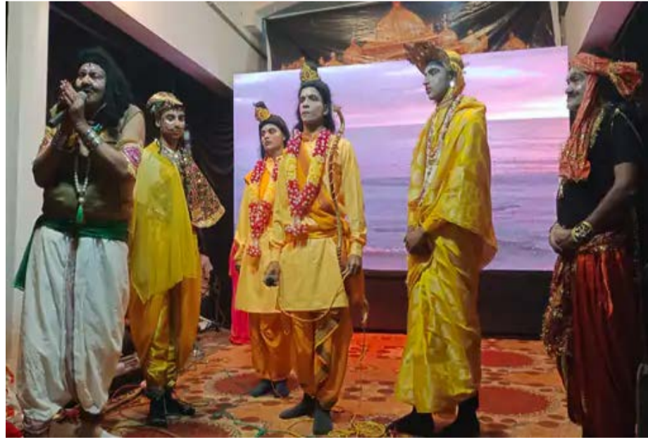
दैनिक कारखाने का सफर। मुलताई

गांधी चौक में चल रही रामलीला में रविवार रात को केवट द्वारा प्रभु राम, लक्ष्मण और सीता को गंगा पार कराने की लीला हुई। केवट और निषादराज के बीच हास्य परिहार से दर्शकों का मनोरंजन हुआ। लीला देखने बड़ी संख्या में नगरवासी उपस्थित हुए। रामलीला की शुरुआत प्रभु राम के वनवास और निषादराज के दरबार से हुई। पिता के वचनों को पूरा करने श्रीराम, लक्ष्मण और पत्नी सीता के साथ वन की ओर रवाना हुए। वन में श्रीराम के आने की सूचना मिलते ही निषादराज फल लेकर उनके पास पहुंचे। श्रीराम और निषादराज के बीच मार्मिक संवाद हुआ। विश्राम करते समय निषादराज और लक्ष्मण