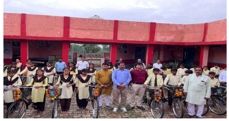
दैनिक कारखाने का सफर। पठा