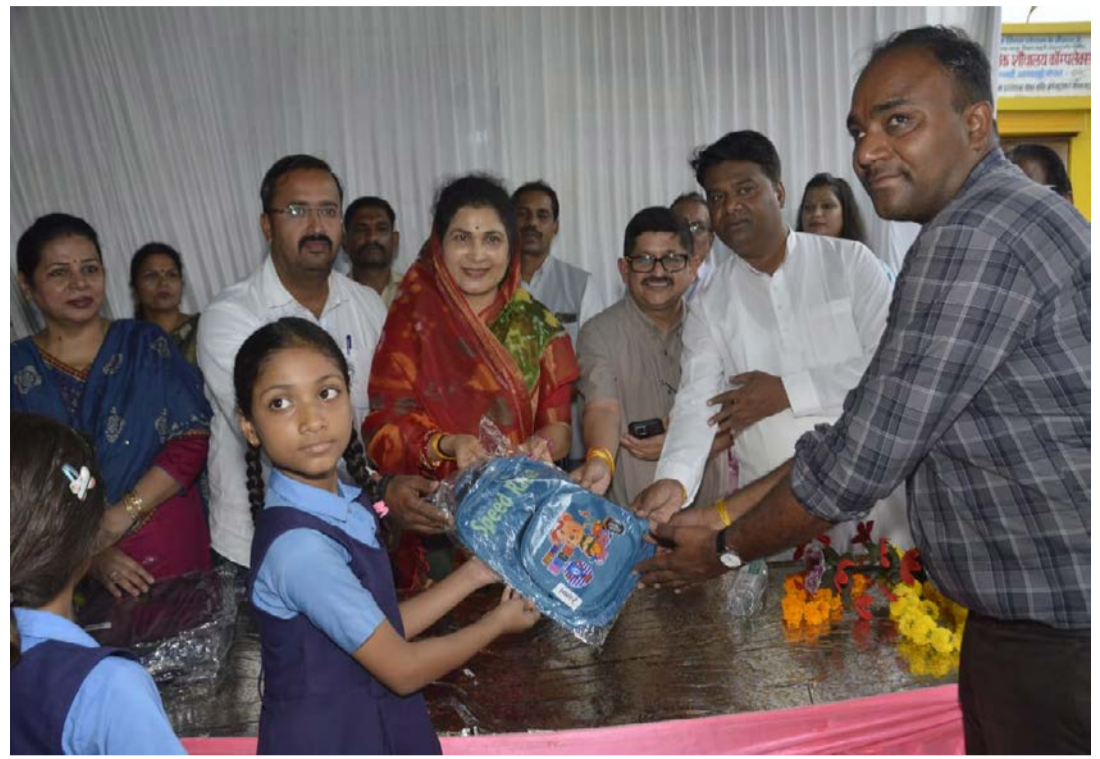
दैनिक कारखाने का सफर। भोपाल